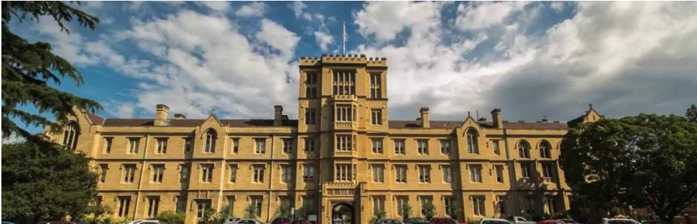
University of Melbourne, Australia