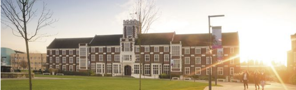
Loughborough University, UK