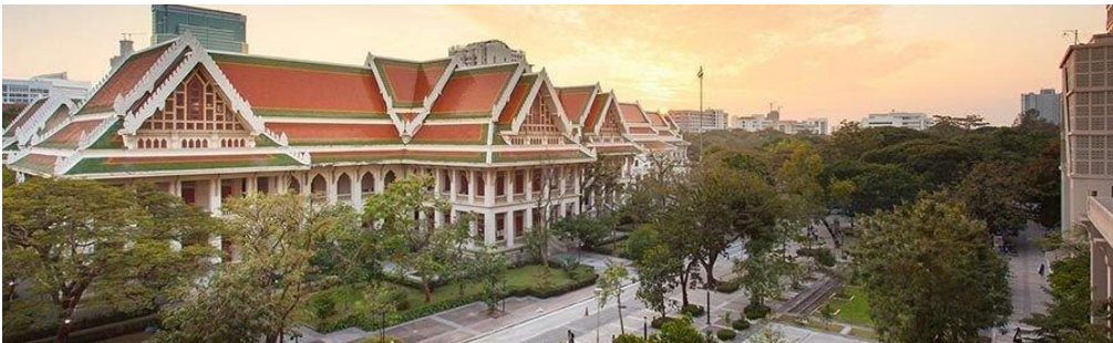
Chulalongkorn University, Thailand