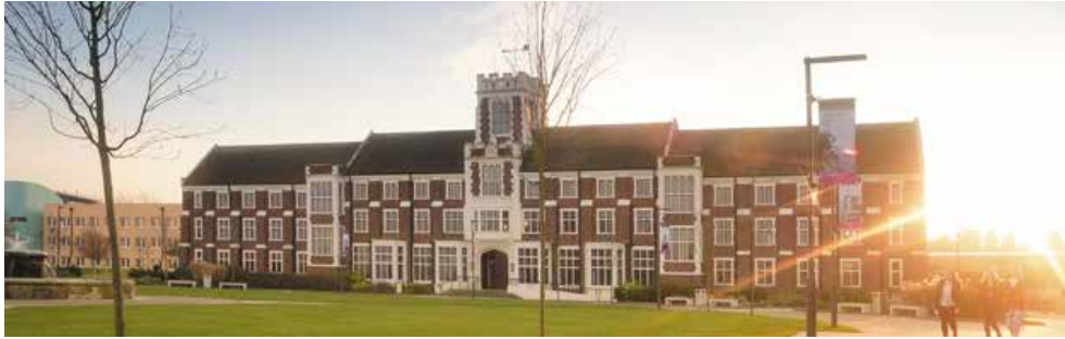
Loughborough University, UK