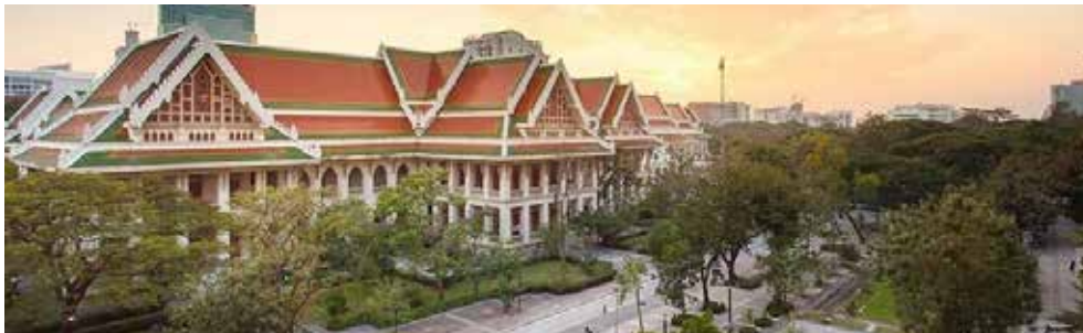
Chulalongkorn University, Thailand