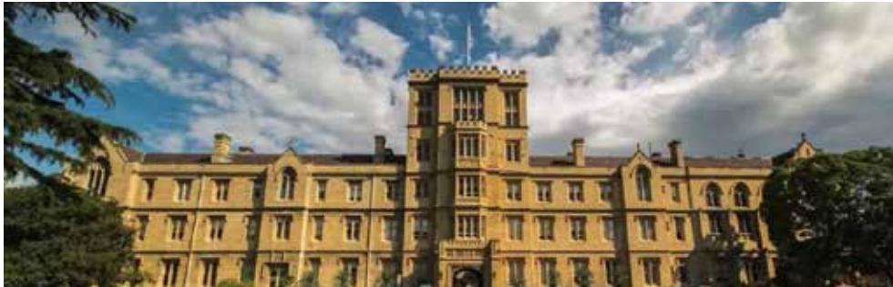
University of Melbourne, Australia